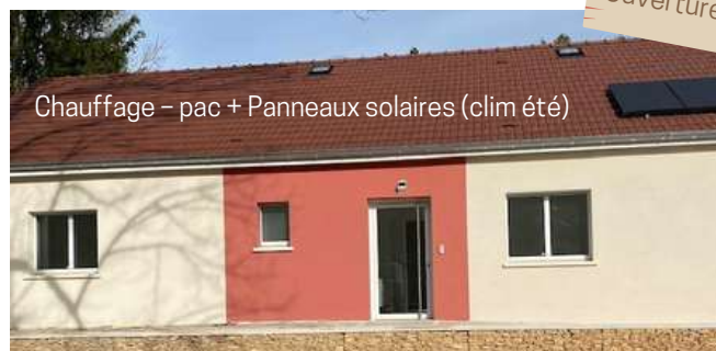
Chauffage - pac + Panneaux solaires (clim été)

Le centre de santé accueillera: 2 médecins généralistes, 1 ostéopathe, 1 infirmière et pourquoi pas vous ?